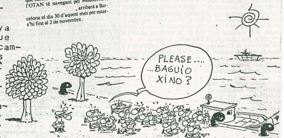
BARCELONA - Un grup de vaxens que formen l'actual divisió marina que l'OTAN té navegant pel Mediterrani. arribarà a Bar-celona el dia 30 d'aquest mes per estar-s'hi fins al 2 de novembre.

Anaren pa-ssant els dies i la UCD es va des-fer, emportant-se el PSOE la mayo-ria absoluta, pero vet aquí que el abans era blanc després fou marró, i cada dia que passava s'enfosquia mes, fins que presionat per les esquerres el Govern del PSOE es decidí a dir a terme el re-ferendum sobre l'OTAN. Pero els mandatariis socialistes ja havien canviat, i els que primer demanaven sortir, ara demanaven entrar. El referendum es va portar a terme i va guanyar la tesi del Govern d'OTAN si però no, es a dir, de no entrar al comandament militar, no fer maniobres conjuntes, ni deixar entrar armament nu-clear a Espanya.